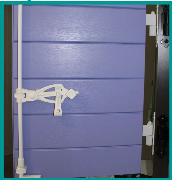
Volet provençal à lames horizontales