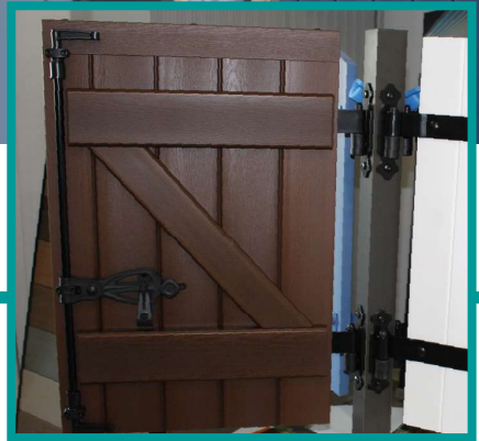
Possibilité emboiture haute et basse