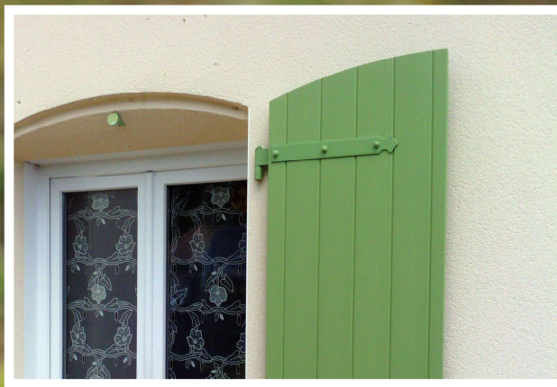
Penture / contre penture